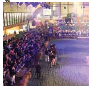
La Nuit de la Holstein Libramont

A la veille de sa 20e édition, la Nuit de la Holstein a atteint un niveau de perfectionnement sans précédent. Ce superbe show son et lumière est l'événement de l'année qui a l'art de sublimer les vaches Holstein pour les rendre plus belles et plus performantes que jamais. Son jeu de son et lumière ne laisse aucun éleveur ni spectateur indifférents. Grâce à ce show, les éleveurs wallons attirent la convoitise des éleveurs étrangers pour être regardés à travers le monde entier. 4 d'entre eux ont obtenu le titre suprême depuis la création du BENELUX (2009). Souvent comparée à la Swiss Expo (référence européenne internationale), la NH ne cesse de grandir et tire avec elle les éleveurs wallons vers le top.