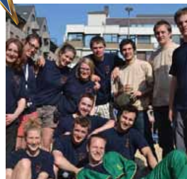
Les Journées du Monde Rural Louvain-la-Neuve

Depuis 20 ans, « la Journée du Monde Rural » rassemble, le temps d'une journée, citadins, estudiantins et acteurs du monde agricole au centre de la cité universitaire de Louvain-La-Neuve. Cette mise en présence permet à tout néophyte, petits et grands, de rencontrer de plus près le monde rural par de nombreuses activités aux choix (dégustation, exposition d'animaux et matériel agricole, stands d'informations, débats, activités ludiques,...). Cette initiative du kot à projet « Le Semeur » relève un défi de taille : révéler aux étudiants et citoyens la diversité de la Wallonie et son potentiel en matière agricole.