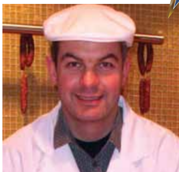
Boucherie de la ferme Pondrôme